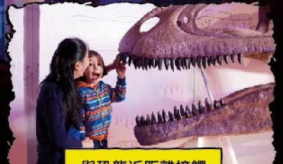
與恐龍近距離接觸