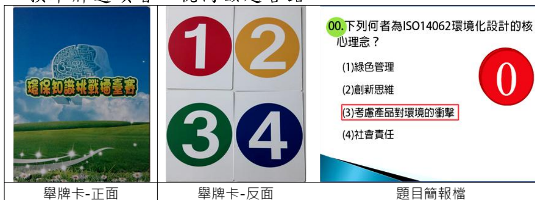
圖 1. PK 賽數字舉牌及題目簡報

十一、司儀宣讀題目後唸出「請準備」，參賽者手持選定牌子但不舉起，待司儀唸出「3、2、1，請舉牌」時，全體參賽者必須同時將牌子舉起至胸前高度，未舉牌或更換舉牌選項者，視同該題答錯。